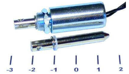
Darstellung im bestromten Zustand